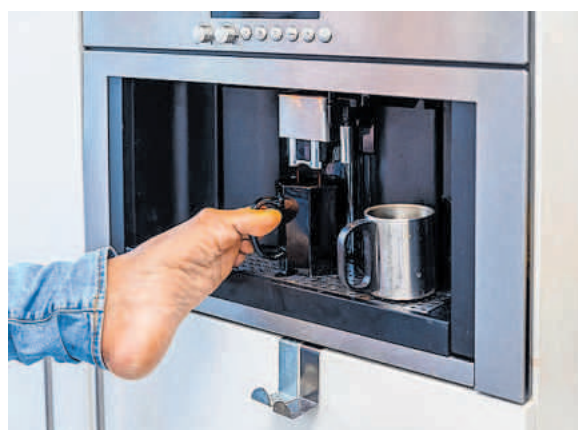
Bakje koffie zetten.