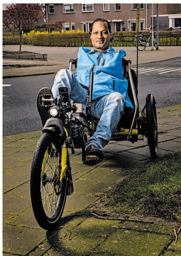
Op de ligfiets met schouderbesturing.