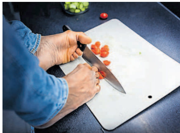
Sander koopt nooit een kant-en-klaarpakket, maar snijdt alle groente zelf.

Na de basisschool ging Sander naar de mavo in het dorp, op loopafstand van huis. Een >>