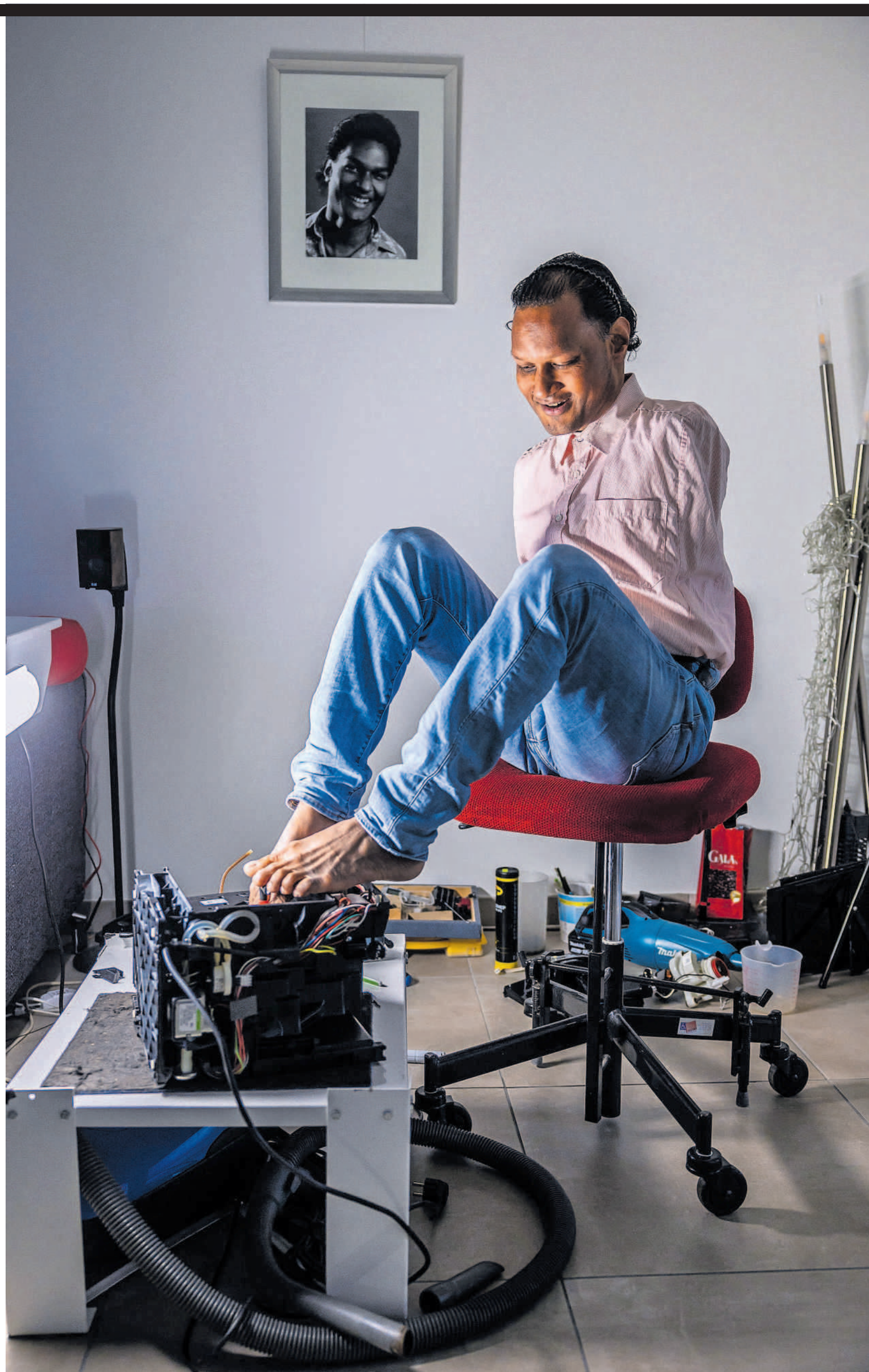
Aan het werk als reparateur van koffiemachines.